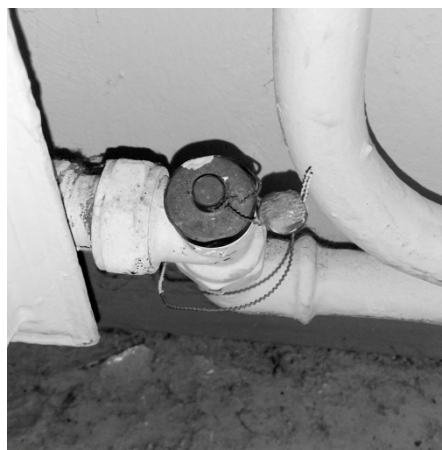
T de réglage d'origine

Les éléments plombés (à l'origine) sont les T de réglage , ils sont situés en bas des radiateurs du côté du robinet. Ils ne doivent surtout pas être ouverts pour "purger", ils seraient impossibles à remettre en place sous la pression de l'eau. Il ne sortirait que de l'eau et non de l'air. Le T de réglage sert à régler la vitesse de circulation de l'eau et ne doit être manipulé que par un professionnel. Ils ont à l'origine été plombés pour régler convenablement la distribution de l'eau du chauffage dans la résidence.